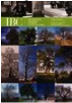
"IBC" X, 2002, 4

Contiene il dossier Giardini di città Il dossier realizzato per "Vivi il verde" 2017 propone le immagini del workshop fotografico organizzato a Bologna nel corso dell'edizione 2016. Le foto sono state oggetto di una mostra.