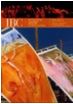
"IBC" X, 2002, 2

Contiene il dossier Il Catalogo forma ed essenza del patrimonio