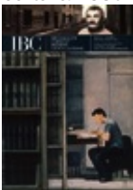
"IBC" X, 2002, 1

Contiene il dossier Un'estate che ricomincia / Immagini, voci e opinioni diverse per riflettere sulle manifestazioni culturali estive e la loro collocazione nell'ambito dei centri storici.