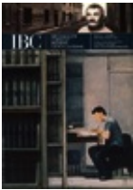
"IBC" X, 2002, 1

Contiene il dossier Un'estate che ricomincia / Immagini, voci e opinioni diverse per riflettere sulle manifestazioni culturali estive e la loro collocazione nell'ambito dei centri storici.