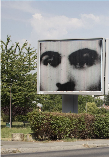
"IBC" XXV, 2017, 3

Contiene il dossier Giardini di città Il dossier realizzato per "Vivi il verde" 2017 propone le immagini del workshop fotografico organizzato a Bologna nel corso dell'edizione 2016. Le foto sono state oggetto di una mostra.