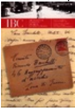
"IBC" X, 2002, 3

Contiene il dossier Ben(i) comunicati? / La parola a chi ogni giorno, per professione, comunica il nostro patrimonio culturale al pubblico della televisione, della radio, dei quotidiani, delle riviste e delle mostre.