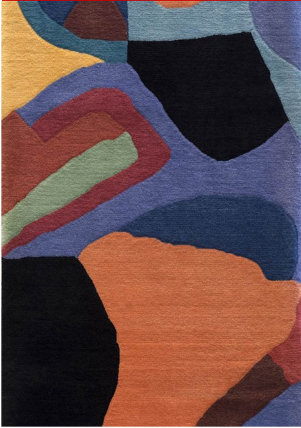
"IBC" XXV, 2017, 1

Contiene il dossier Il Catalogo forma ed essenza del patrimonio