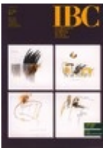
"IBC" IX, 2001, 4

Contiene il dossier Scienze e natura al Salone di Ferrara / In occasione del nono Salone ferrarese del restauro presentiamo lo stato dell'arte in due settori di intervento dell'IBC: il sistema emiliano-romagnolo dei musei scientifico-naturalistici e quello dei parchi e delle riserve.