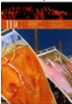
"IBC" X, 2002, 2

Contiene il dossier Un'estate che ricomincia / Immagini, voci e opinioni diverse per riflettere sulle manifestazioni culturali estive e la loro collocazione nell'ambito dei centri storici.