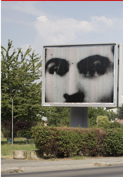
"IBC" XXV, 2017, 3

Contiene il dossier Giardini di città Il dossier realizzato per "Vivi il verde" 2017 propone le immagini del workshop fotografico organizzato a Bologna nel corso dell'edizione 2016. Le foto sono state oggetto di una mostra.