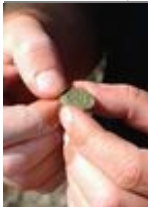
"IBC" XXIII, 2015, 4