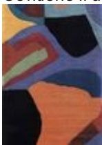
"IBC" XXV, 2017, 1

Contiene il dossier Piccoli luoghi crescono /