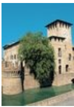
"IBC" XXIII, 2015, 3