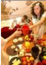
"IBC" XXIII, 2015, 2

Contiene il dossier ALIMENTA - Gusti e ingredienti di un festival / La diciassettesima edizione di "Antico/Presente. Festival del Mondo Antico", svoltasi a Rimini dal 19 al 21 giugno 2015, è stata dedicata ai significati culturali del cibo, tra terra e mare.