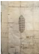
"IBC" XXIV, 2016, 1