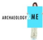
"IBC" XXIV, 2016, 2

Contiene il dossier Il Catalogo forma ed essenza del patrimonio /